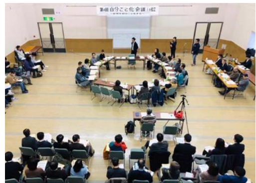
参考：自分ごと化会議 in 松江